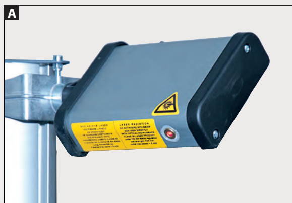
PUNTATORE LASER per allineamento longitudinale.