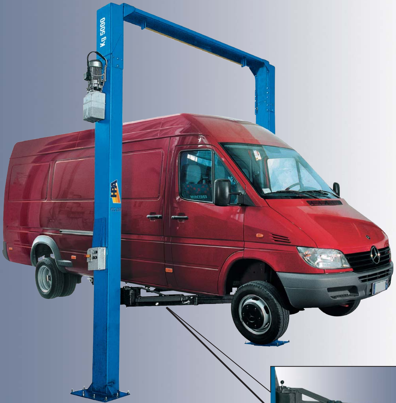
P2C 250 HTS-V